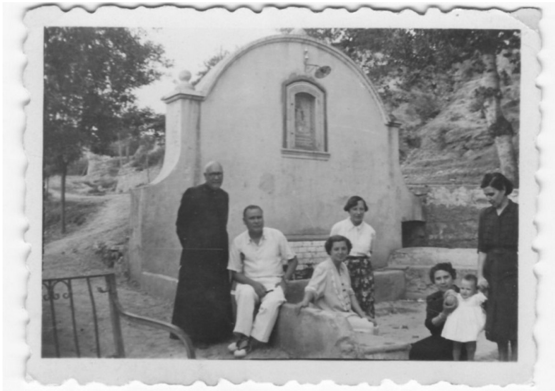
Figura 5. Retrat en grup a la Font Jordana, 1952.

recerca és més per un tema concret que per una col·lecció en particular. Així doncs, s'han organitzat cinc grans temàtiques que aglutinen subseccions: Poble, Persones, Festes, Vida Cultural i Vida Pública. Llavors i en resum, el material de l'Arxiu s'organitza per col·leccions, en quatre blocs, i per temàtiques.