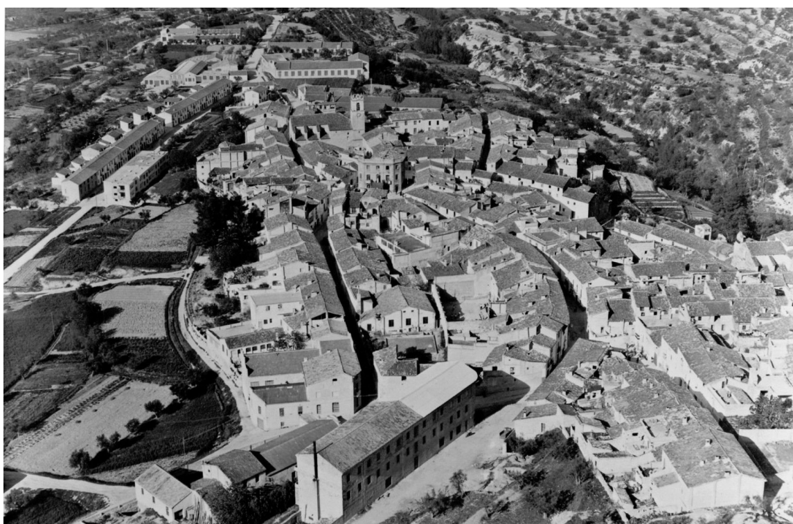
Figura 1. Vista aèria d'Agullent, 1950.

obert, que no són cap novetat. En la Llei 10/2007, de 22 de juny, de la lectura, del llibre i de les biblioteques exigeix la digitalització de les col·leccions analògiques per tal d'ampliar el seu ús en la societat de la informació. Aquesta mesura segueix la línia marcada per la Comissió Europea, que, actualitzant les mesures adoptades l'any 2006, fa una Recomanació, de 27 d'octubre de 2011, on demana un augment d'esforços per a digitalitzar i conservar "la memòria cultural d'Europa", així com dotar de major accessibilitat al patrimoni cultural. Així doncs, hi ha tota una sèrie de normatives i documentació per tal de mamprendre la digitalització de materials patrimonials, com ja ho han fet diferents institucions al País Valencià i són clau per a ajudar arxius més modestos a no cometre errors, o almenys cometre els mínims. Per tant, podem esmentar la tasca de la Biblioteca Valenciana, l'Arxiu General i Fotogràfic de la Diputació de València, l'Arxiu de la Diputació d'Alacant, l'Arxiu de la Diputació de Castelló o el Museu Etnogràfic de València.