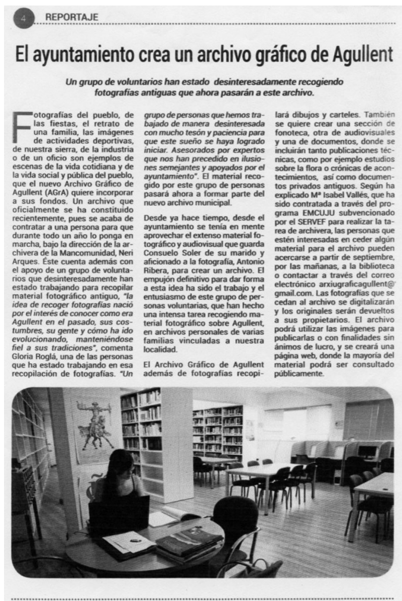
Figura 2. Retall de premsa. Article "El ayuntamiento crea un archivo gráfico de Agullent". Any desconegut.

del poble guarden, o que són i han viscut en algun temps a Agullent, perquè ajudaran a construir una història local complexa i completa. A més a més, en aquest espai també es vol abocar tot aquell patrimoni relacionat amb Agullent i la seua gent que resta en diferents associacions locals, en l'Ajuntament, en la parròquia i en les diferents institucions públiques de qualsevol índole.