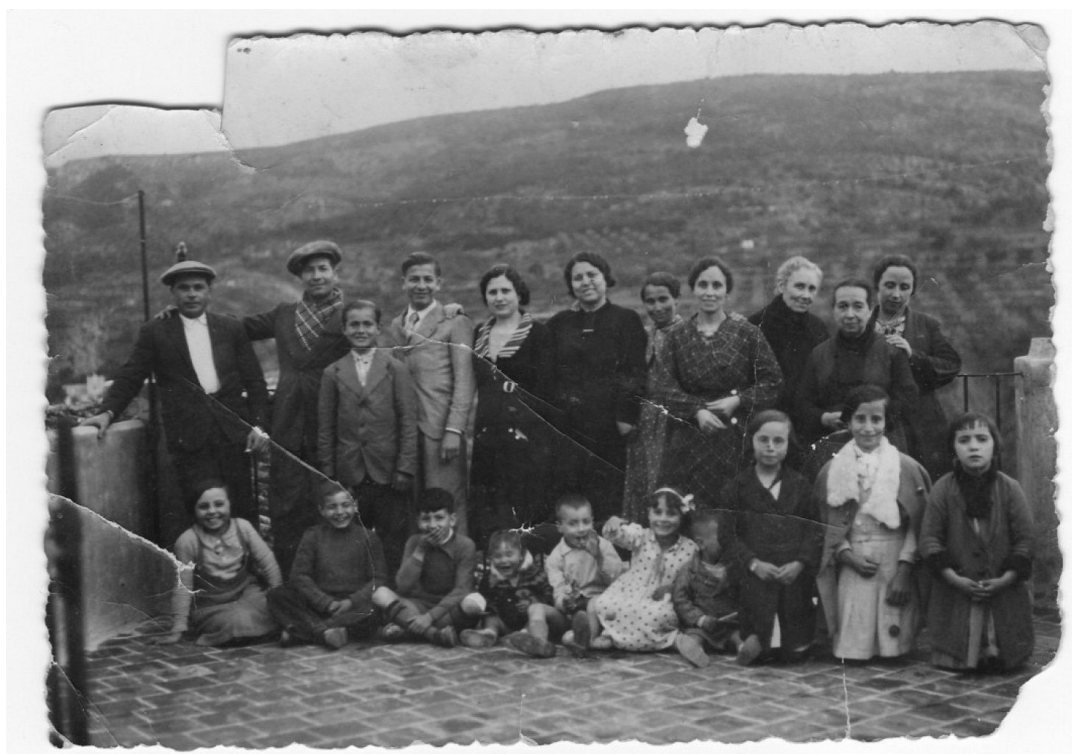
Figura 7. Retrat familiar a la casa del iaio i la iaia al carrer del Canonge Tormo, 1935. Col·lecció Família Calabuig Soler. Font: Arxiu Gràfic d'Agullent.

Dit i fet, l'acceptació per part de la ciutadania, de persones estudioses i de diferents arxius ha sigut bona, destacant les particularitats que té, i especialment pel fet de ser un dels primers arxius d'aquest tipus i municipal. La inauguració de l'espai web ha sigut la fita que ha marcat l'ensorrament de les reticències que hi havia per a cedir el material a l'arxiu. A més a més, s'han aconseguit més col·leccions i més ajuda de particulars i professionals de la fotografia. Les bones sensacions s'han pogut traduir en les visites que ha tingut el web des del mes d'agost de 2021 fins a gener del 2022, arribant a les 25.037 visites.