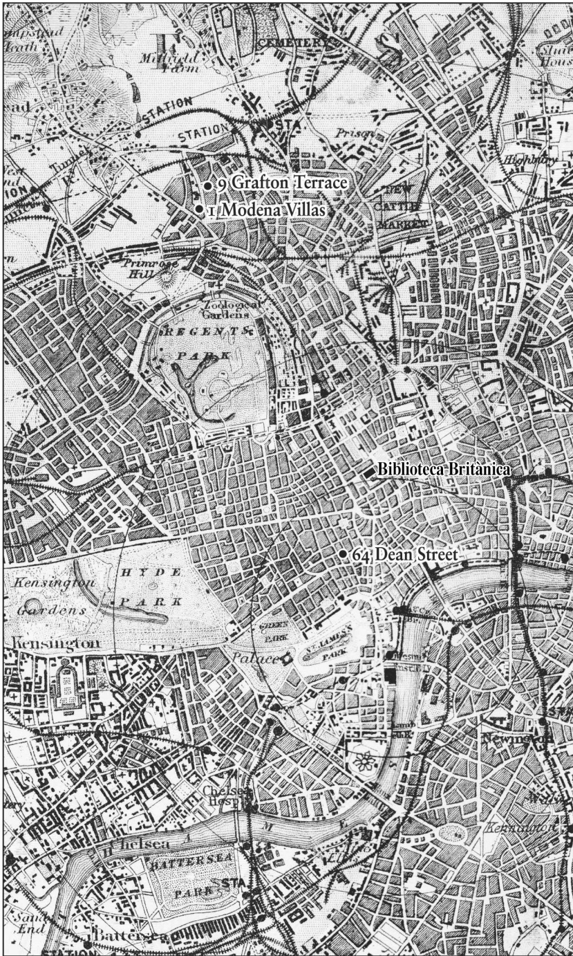
Mapa 4. El Londres de Marx, 1848-1883.