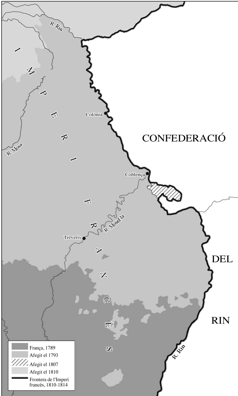
Mapa 2. L'ocupació francesa de la Renània durant la Revolució i l'era napoleònica.