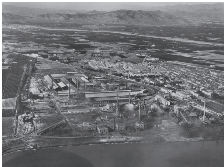
Vista aèria del Port de Sagunt. Mitjans del segle xx. Dipòsit Biblioteca Valenciana Nicolau Primitiu

La perspectiva que recull aquest treball presenta la noció de «patrimoni cultural» i, per extensió, la noció de «patrimoni industrial» com un procés de negociació i presa de decisions sobre la projecció, l'ús i la gestió tant del passat com de les representacions socials i les imatges que n'emanen. Més enllà del resultat final i conlús de la recuperació, la salvaguarda i la posada en valor de distints objectes culturals, el més important a ressenyar és que aquest fet està marcat per la negociació pròpia d'un procés social caracteritzat per la relació entre diferents agents patrimonialitzadors. D'acord amb Smith, «el patrimoni no és una 'cosa', o un lloc, més aviat és una representació